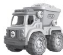
C - Lomový sklápač - 24 kusov