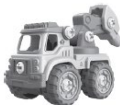
E - Vítací voz - 29 kusov