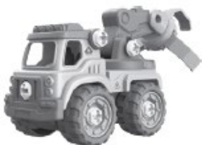
D - Auto s drapákom na drevo - 33 kusov