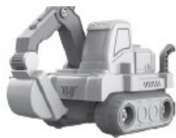
A - rýpadlo - 25 kusov

Pri montáži dielov postupujte podľa pokynov na obrázkoch A až F v návode na montáž.