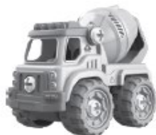
B - Miešacie auto- 24 kusov