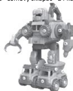
F - Robot 5 v 1 - 133 kusov