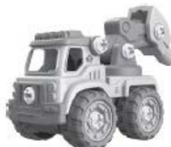
E – Vrtný vůz – 29 kusů