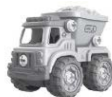
C – Lomový sklápěč – 24 kusů