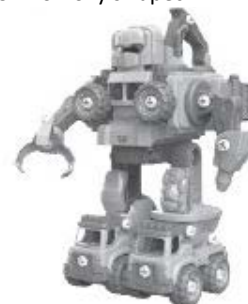
F – 5 v 1 Robot – 133 dílků