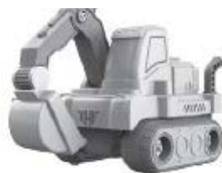
A – Bagr – 25 kusů

Pro sestavení dílků se prosím řiďte pokyny na obrázcích od A do F v montážním návodu.