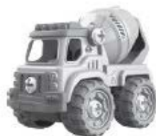
B – Míchací vůz – 24 kusů