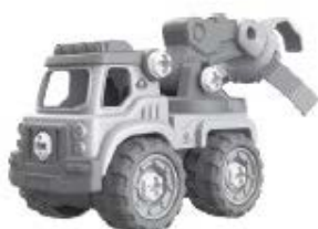
D – Vůz s drapákem na dřevo – 33 kusů