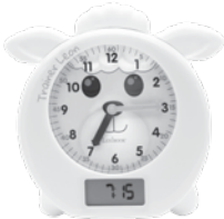
1 x wecker Trainer Leon

Wenn Sie das Gerät auspacken, stellen Sie sicher, dass die folgenden Teile enthalten sind: