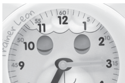
Ich schließe meine Augen, wenn es Zeit ist, schlafenzugehen