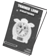
1 x Bedienungsanleitung

WARNHINWEIS: Alle Verpackungsmaterialien, wie z. B. Klebeband, Plastikfolien, Schnüre und Etiketten, sind nicht Teil des Produkts und sollten entsorgt werden.