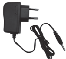
1 x Netzkabel