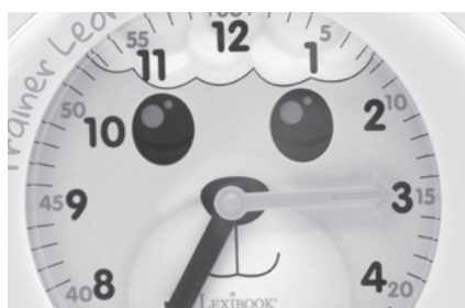
Ich öffne meine Augen, wenn es Zeit ist, aufzustehen